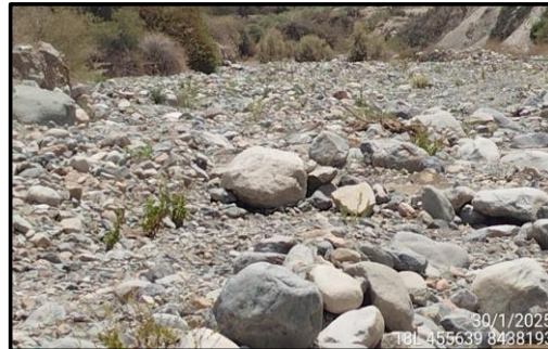
Fotografia N°01: Terrenos de Cultivos para proteccion